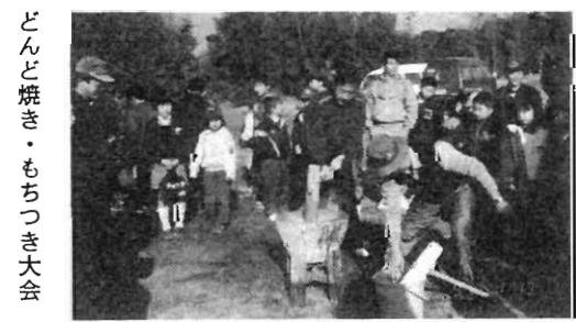
どんど焼き・もちつき大会