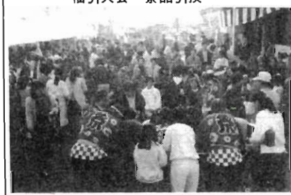
みかんのつかみどり大会