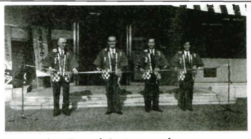
セレモニーとしてのテープカット