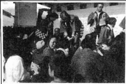
福引大会・景品引換

発行 常盤校区コミュニティ推進協議会 (常盤市民センター内) TEL 22-1455