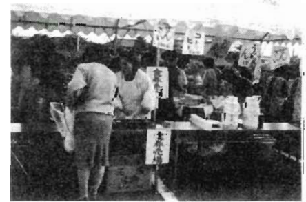
バザーで活躍中のみどりの会

「わたしたちは、交通の立哨もするけど、間違わないでください。婦人の団体です。行事があることに、一番おもてにしたいのですが、目立たない所で、前日から腕を振るって活躍している会で