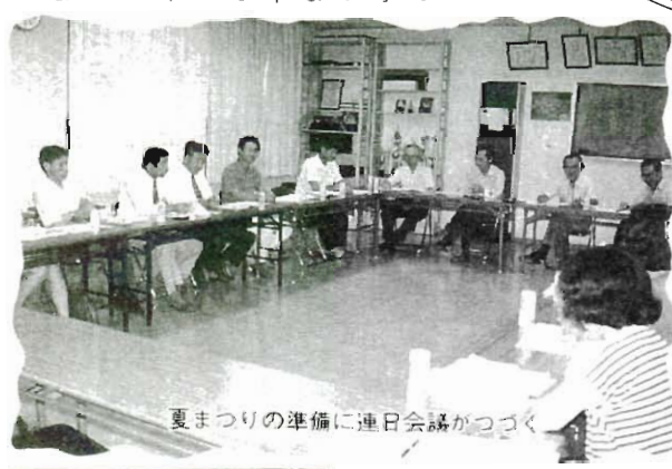
夏まつりの準備に連日会議がつづく

このコミュニティ誌が皆さんのお手もとに届けられた頃は、祭りはもう終わってしましますが、来年は一人でも多くの方が参加していただき、私達の祭りを盛りあげて欲しいとお願っています。