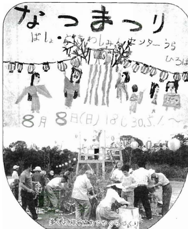
多くの人の協力でやぐらづくり

※ 常子連は常子連のみなさんは慣れておられるのか、判りあてにも何んの不満もない様子、各種団体の人達のまとまりの良さ。又ジュ