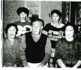
主人は母を良く気遣い、お 互いに気が合うようだ。農 業も気軽に手伝っている。で も私は、未だ主人や母に頼 って何も出来ないでいる。そ ろろ弟子入りしなくては思 っているのだが... 母は野草をこよなく愛し良 く世話をする。毎日の水やり も欠かせない日課である。畑 仕事も、季節に合わせて種ま きをし、苗植えをして、手 をかけて育てた野菜を食べるの は私達である。又親しい人 に分けてあげては喜んでいる。 近所の人達とも良く話す。こ

ペンギンレー掲載用にも ストレス解消になるだろ う。私は母に何でも相談す ると、初めて家族全員で 写真を撮った。初めて と言え、今年の秋の常盤校 区文化祭に、私も共にダ ンスで初舞台を踏んだ。真 赤なギャザースカートに赤 い靴を履いた母達の踊り はとても優雅で若々しく 過ぎていくが何事にも積 極的で明るい。考え方も 進歩的で、既が良。地域 活動やPTA活動を夫婦で やるのも母の理解がある からこそです。