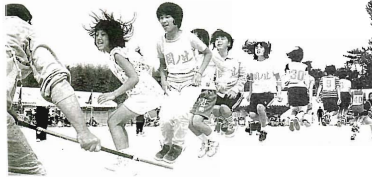
息もピッタリ 大波小波縄跳びゲーム