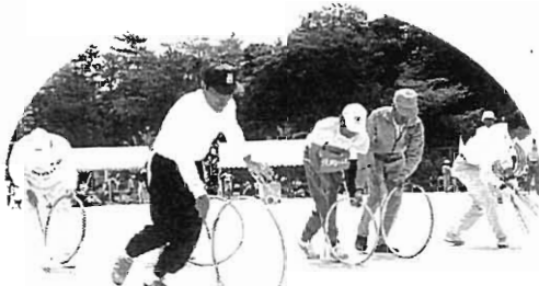
昔とったナントヤラ