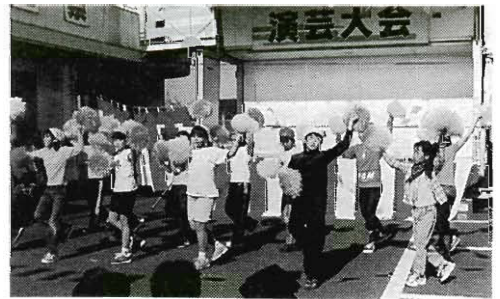
東則貞・北則貞子ども会