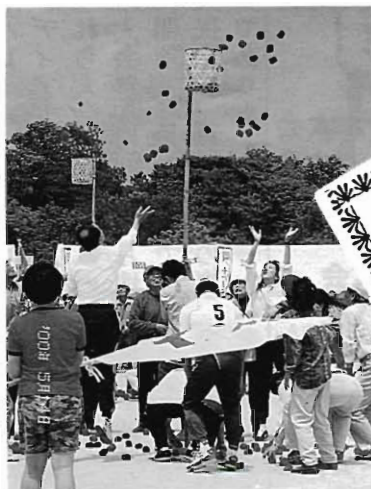
なんとって87個、87個よ!