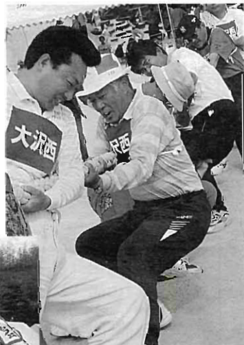
綱引き2連覇 大沢西チーム