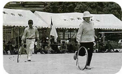
このフレームはアルミ製か?