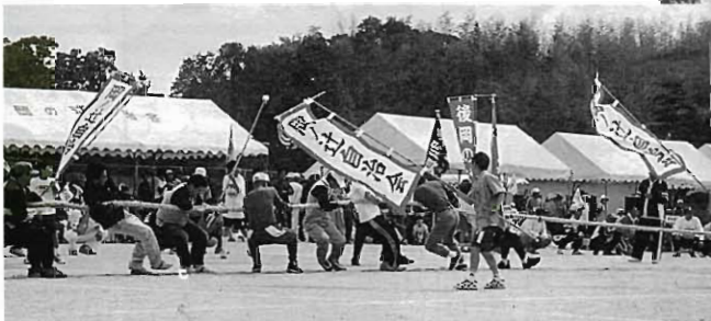
応援旗をみてくれ!

毎年毎年楽しいアナウンスをしてくださっているのは一体誰でしょう。それは秘密です。