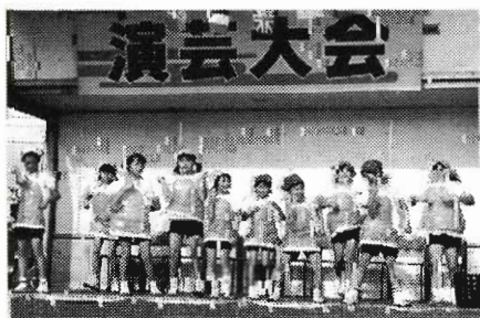
後岡ノ辻子ども会