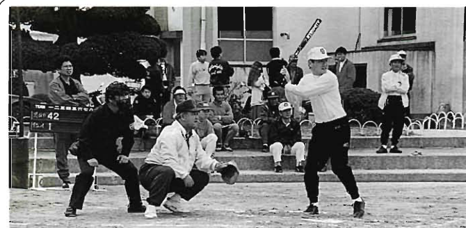
スポーツクラブ紹介