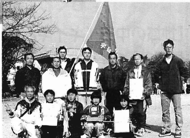
常盤チーム第3位 1時間34分53秒