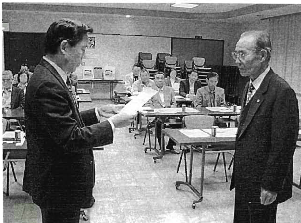
宇部警察署から委嘱状を受ける推進委員

私達17名が常盤長寿社会対策重点地区推進委員になりました。「誰からも声をかけてもらえる」一スタッフになり、地域の方々の為に役にたちたいと思っています。よろしくお願い致します。