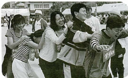
百足(ムカデ)はやめられないナー