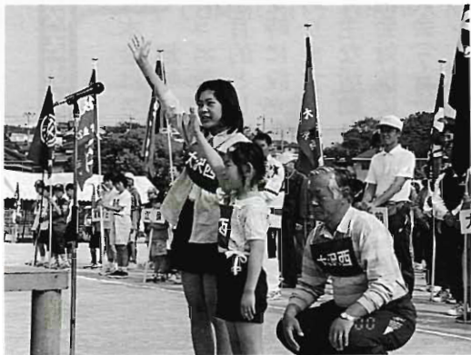
選手宣誓 今年も優勝しました