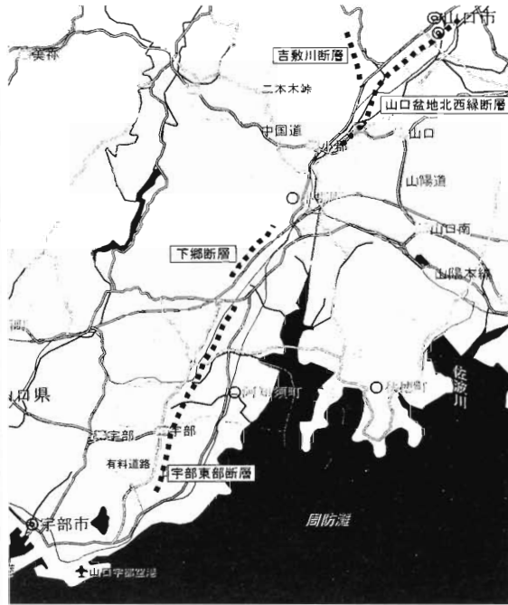
地形図から宇部東部断層の推測位置

「山口大学の地震研究グループ」によると、大原湖から宇部市東部までの57kmの長さで、北から大原湖・山口盆地北西縁・下郷・宇部東部などの断層がある