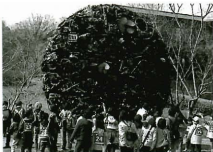
あるウォーク大会

「常盤池の周遊園路をクイズを解きながらゴミ拾いなどで環境について学ぶ」などです。 皆さんのご協力を得て大きな成果にしたいと思っています。