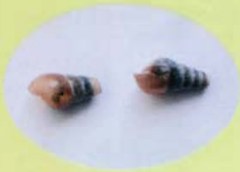
オオクビキレガイ