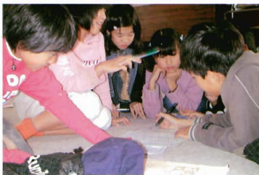
献立はさどうしよう

常盤校区通学合宿が宇部市青年の家で行われました。異年齢の子どもたちが、集団宿泊をしながら