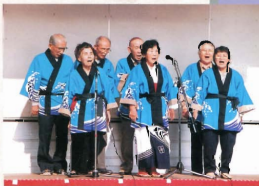
ハア～大きな声はいいですね