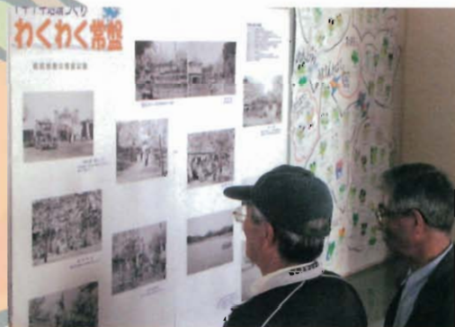
なつかしい常盤公園