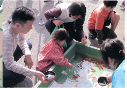
うまくとれるかな？