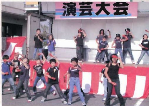
舞台もいっしょに跳ねていました!