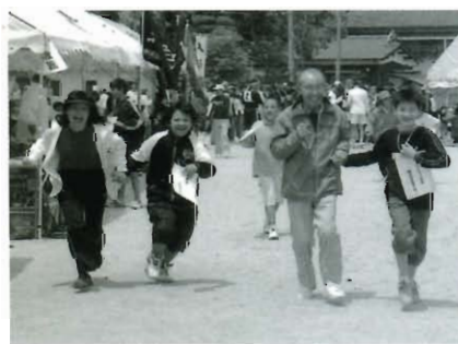
新番組の「借り者」競争