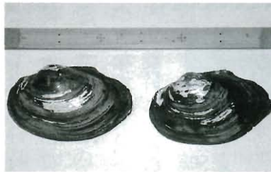
女夫岩池の烏貝 長さ 15cm 厚さ 5cm

採った烏貝ですが、大きくなると三十センチにはなりません。この烏貝は、小学校の池に移住しています。