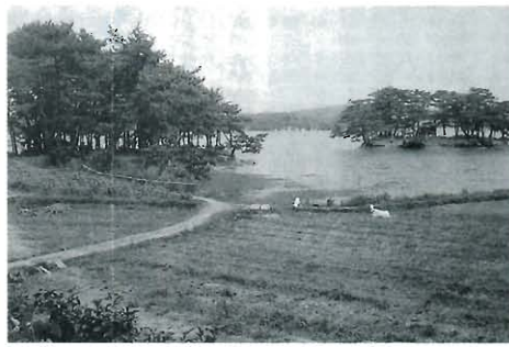
昭和初期の常盤神社