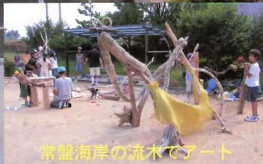
常盤海岸の流木でアート