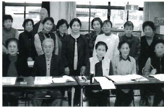
和気あいあいの皆さん