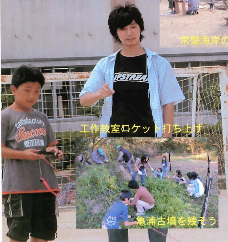
工作教室ロケット打ち上げ