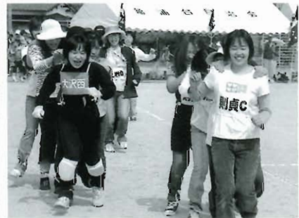
ド迫力の百足競争