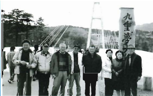
夢の大吊り橋にて