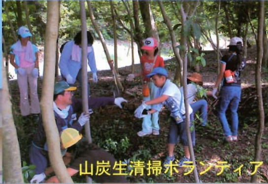
山炭生清掃ボランティア