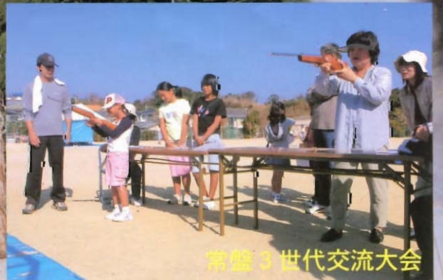
常盤3世代交流大会