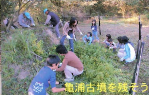
亀浦古墳を残そう