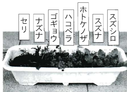
センター職員提供の七草