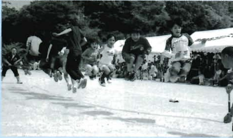
初めて参加した運動会

前日までの雨の心配をよそに、絶好の運動会日和。普段はほとんど顔も合わせることがない、お父さん方もビール片手に楽しそうな笑顔。もちろん子どもたちは大騒ぎ。初出場ながら、皆さんのご協力ですべての採点種