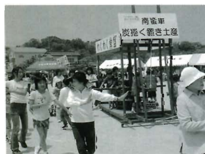
南蛮音頭で心をひとつ

前日の雨が最適なグ ラウンド状態をつくり、 新しいプログラムも加 わり区民大運動会は開 催されました。