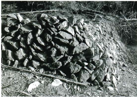
常盤池築堤の石積み

摘されています。この時に常盤池を築堤したときの基礎部分の石積みが姿を現しました。断崖だったと推測される岩盤の間に、幅約二十メートル、高さ二メートル程が現われました。ちなみに、池の水が干上がったのは四回目だそうです。余談ですが、池には「烏貝」が生息しています。今回の干上がった女夫岩池からもいくつかの烏貝を見つけることができました。写真はそのときに