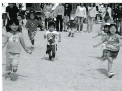
未就学児のここまでおいで