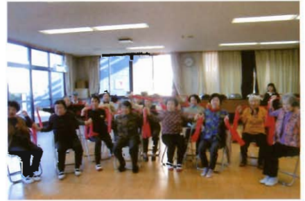
体を動かして元気に

毎回、体温、血圧、握力の測定の後、ストレッチ、パワーアップ体操、リズムカルなダンスと楽しく身体を動かします。保健師、栄養士による健康教室、手工芸、レクリエーション、大きな声で歌を唄ってストレス