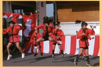
常子連「後岡ノ辻子ども会」