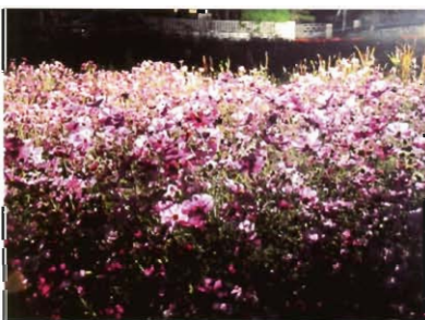
満開になった夜の花広場

り」には花もなく断念を決めました。皮肉にもその後の雨で花畑が満開となり、断念が残念となりました。