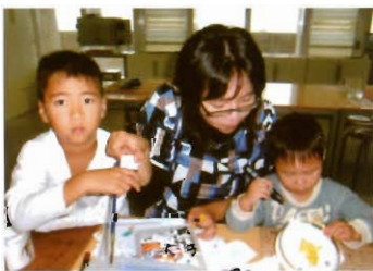
親子でエナメル絵付け