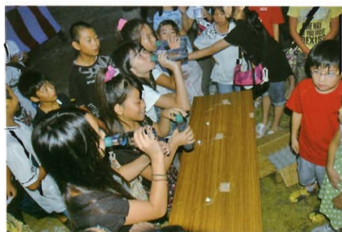
誰がいちばん早い？