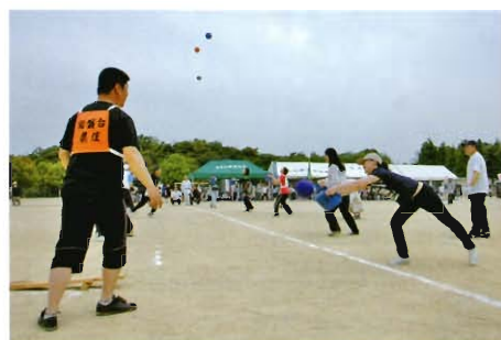
ロケット打ち上げ