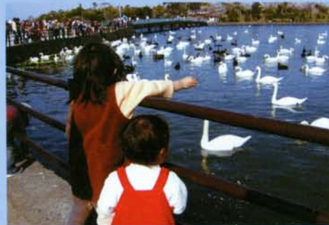
白鳥さん、こっちにおいて!

足を延ばせばすぐ常盤公園に行ける。手を伸ばせば、白鳥たちが寄ってくる。何年も、何十年も当たり前のことでした。毎年、毎シーズン通いました。その昔、私が子ども頃の頃も・・・近いが故に鳴き声が聞こえてきそうに寂しいですね。 亀浦北 原田 俊弘