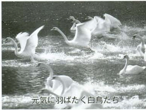
元気に羽ばたく白鳥たち

昭和三十二年七月七日に、第一陣のコブ白鳥がオランダロッテルダム市シンブルグ動物園から迎えられて、祝福のパレードで常盤池に放たれた、以後ドイツから更に白鳥を、オーストラリアからは黒鳥が迎え入れられた。 自家繁殖して五〇〇羽にも達したこともあり、白鳥の親子が遊ぶ当たり前の姿が寂しい風景に様変わりした。