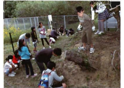
亀浦子ども会の奉仕作業

二mです。また、古墳東側の道は、周防・長門の国境です。郷土の歴史を知るうえでの貴重な遺跡です。