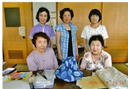
とても楽しい教室です