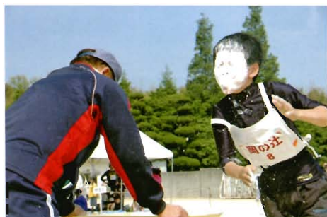
記念大会の会長賞でした

好天に恵まれて、第25回区民大運動会が開催されました。今回は、記念大会として特別賞もあり、また久しぶりに、〇×ゲームが「わくわく常盤」の10周年を記念して行われました。