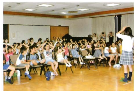
ジュニアリーダーと手遊び