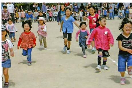
元気よくよーいドン