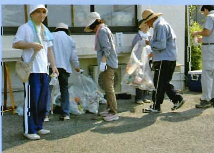
続々集まるゴミの山