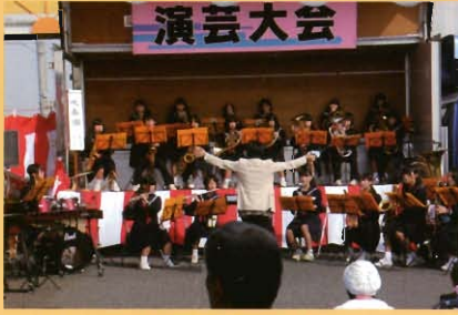
西岐波中プラスバンド