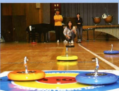
ポイントめがけて